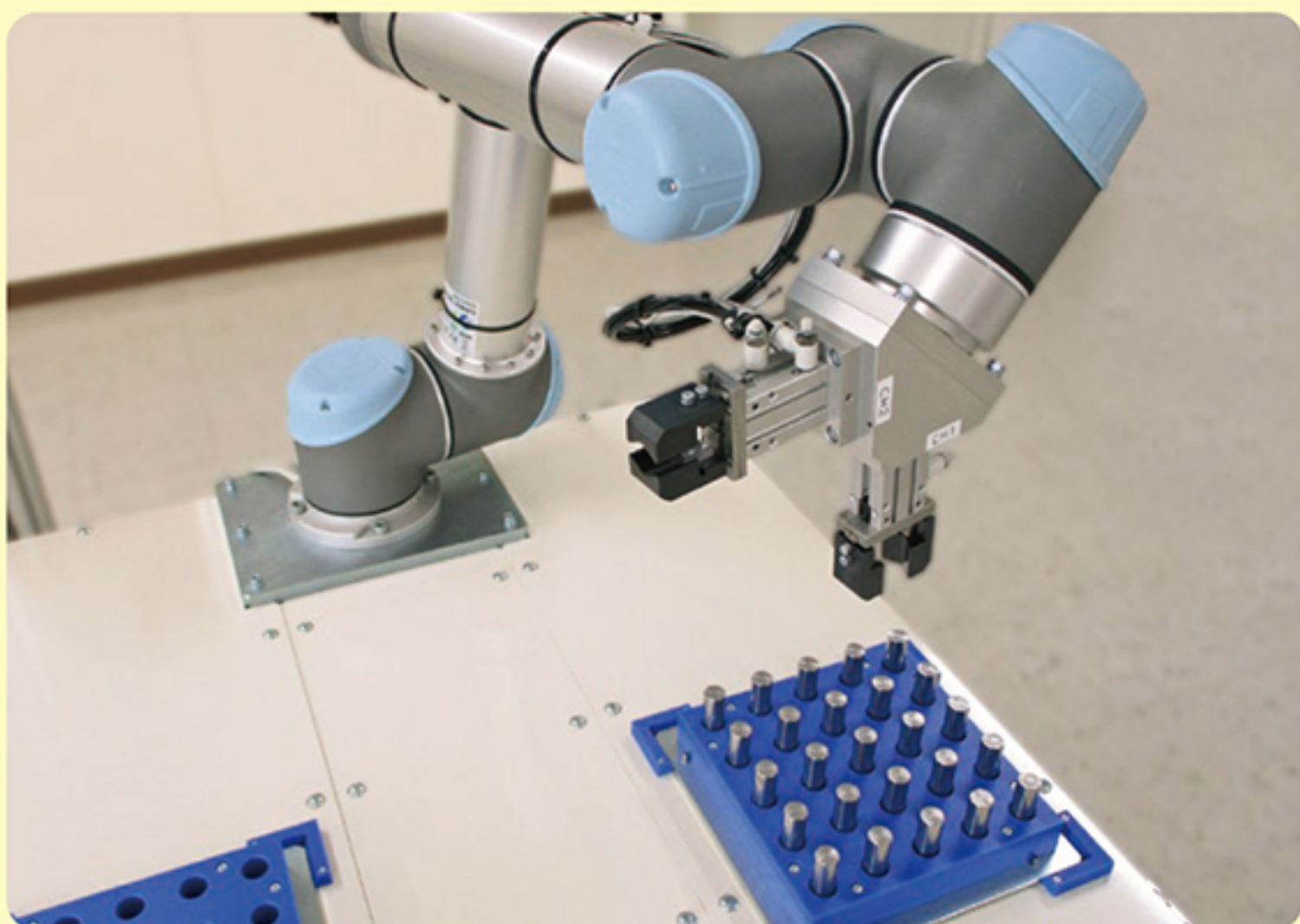
マシンテンディング デモ機